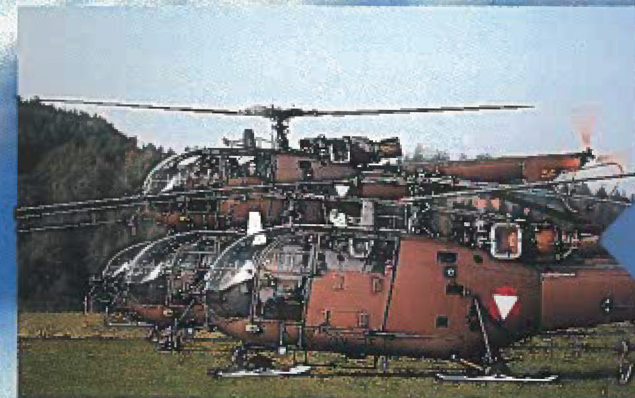
Das Österreichische Bundesheer (hier mit Alouette III Hubschraubern) darf natürlich nicht fehlen.