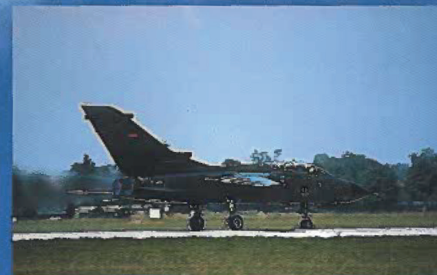
Rückgrat der deutschen und britischen Luftwaffe: Vier „Tornado“ werden erwartet.