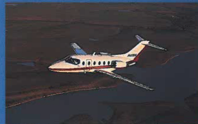
Business-Jets und Verkehrsflugzeuge bilden den anderen Schwerpunkt des Flugtages.