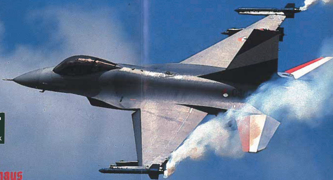
Top-Gun hautnah - die berühmte F-16 in Action.