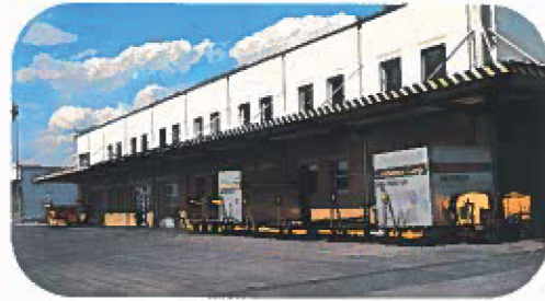
1000 m 2 für die Luftfracht

Folgende Frachtgeräte sind jederzeit einsatzbereit: 4 Hubstapler bis maximal 8 Tonnen, Handhubwagen, hydraulische Hebebühne, E-Schlepper, Hochhubwagen für Schwergut, mobiles Förderband und Palettentrolleys.