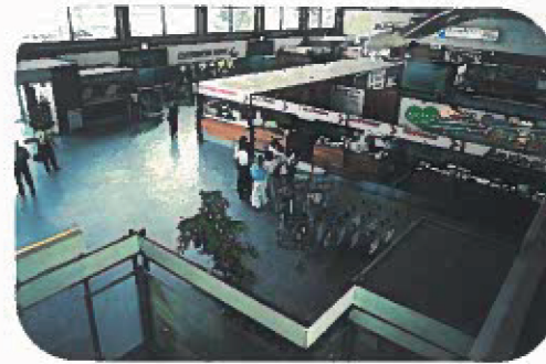
Die Abfertigungshalle für verwöhnte Fluggäste

Fluggäste der Fluggesellschaften Austrian, Lufthansa, Swissair, Tyrolean, AAS, Tunisair und Hispania werden von der Austrian Airlines für die Flughafen Graz Betriebsgesellschaft abgefertigt. Die Lauda Air hingegen fertigt ihre Fluggäste selbst ab.