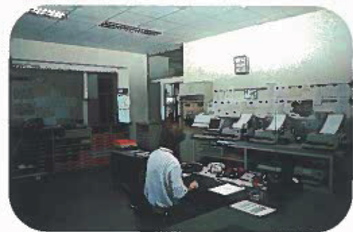
Der Flugwetterdienst, ein wichtiger Bestandteil der Luftfahrt

Die renommierte Klassifikation IIIa/b äußert sich in der ICAO-Definition als Ausweichflughafen für Wien, München, Zagreb, Klagenfurt u. a.