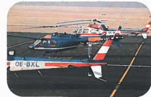
Für Notfälle: der Flugrettungsdienst

Der Flughafen Graz ist auch Heimatflughafen der Verkehrspilotenschule von AUSTRIAN AIRLINES, sowie von 2 Motorflugschulen, einer Hubschrauberschule, zwei Segelflugschulen und einem Fallschirmspringerclub.