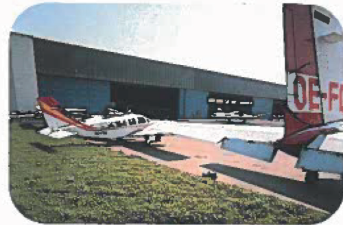
Werft und Hangar, ein Teil der Infrastruktur

Folgende Frachtgeräte sind jederzeit einsatzbereit: 4 Hubstapler bis maximal 8 Tonnen, Handhubwagen, hydraulische Hebebühne, E-Schlepper, Hochhubwagen für Schwergut, mobiles Förderband und Palettentrolleys.