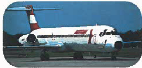
AUSTRIAN MD 81

Die wichtigsten Flugzeugtypen, die Graz laufend frequentieren: