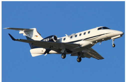
Die Proair Embraer 505 Phenom 300 D-CPAV kurz vor dem Aufsetzen auf Runway 16C am Graz Airport