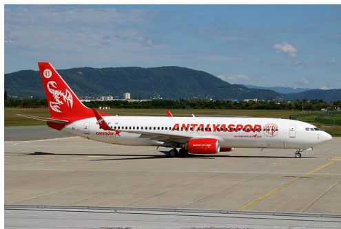
Die Boeing 737 TC-TJY von Corendon Airlines bewirbt mit ihrer Sonderlackierung den türkischen Fußballverein Antalyaspor.