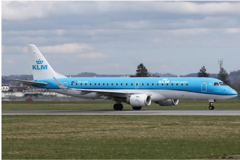
Am 27. März fand der letzte KLM Linienflug von Graz nach Amsterdam statt. Zum Abschied kam die KLM Cityhopper Embraer 190 PH-EZW.