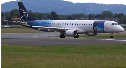
Die Kurzkette nach Tivat, welche von Mai bis Juni angeboten wurde, flog Air Montenegro mit den zwei Embraer 195 40-AOA und 40-AOB.