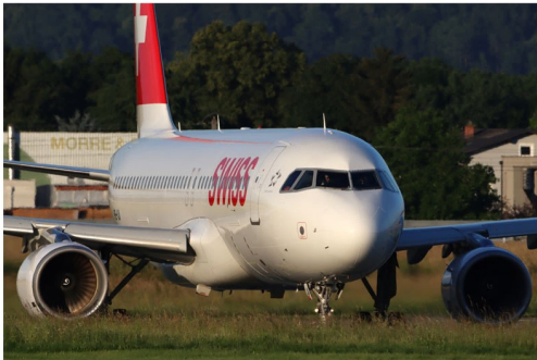
Auf Grund der guten Buchungslage kam am 5. Juni der Swiss Airbus A320 HB-III auf dem Zürich Kurs zum Einsatz.