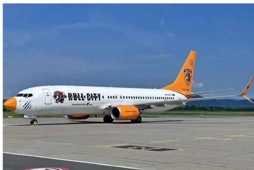
Eine weitere Sonderlackierung, diesmal auf der Corendon Airlines Boeing 737 9H-CXG, bewirbt den englischen Fußballverein Hull City.