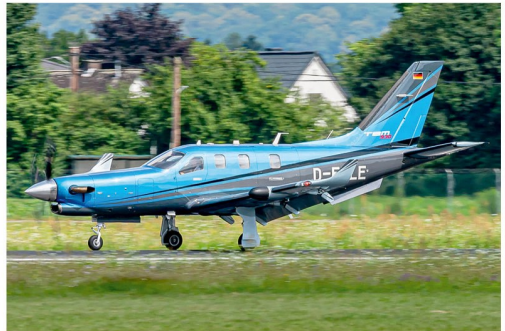
Der Flugplatz mit dem IATA-Code SMV war Ausgangspunkt der Socata TBM-930 D-FELE, welche am 24. Juni in Graz landete.