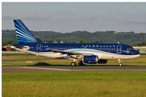
Eine weitere Erstlandung erfolgte am 5. Juni mit dem Airbus A319 von Azerbaijan Airlines, ebenfalls mit der Nationalmannschaft an Bord.