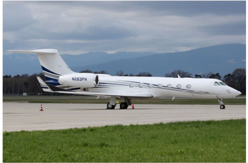
Vom 26. auf den 27. März stand die Global Services Gulfstream G550 N283PH am Vorfeld Nord des Graz Airport.