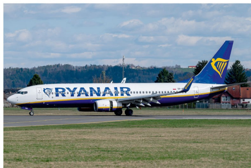
Von Katowice nach Graz und weiter nach Helsinki ging es am 25. März für die Boeing 737-8AS SP-RND des Ryanair Ablegers Buzz.