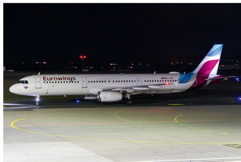
Nach einer Streikwelle in Deutschland setzte Eurowings am 14. März als Verstärker den Airbus A321 D-AIDT ein.