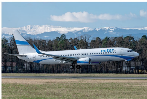
Ein weiterer Charter für die Mannschaft des SK Sturm Graz brachte am 13. März die Enter Air Boeing 737 SP-ENU nach Graz