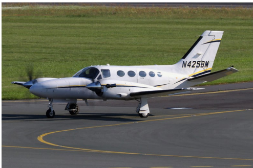
Die zweimotorige Cessna 425 Conquest II N425BM verfügt über eine Druckkabine und bietet bis zu sieben Passagieren Platz.