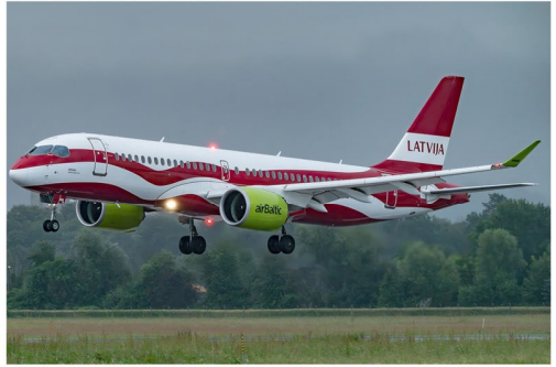
Neben der Air Baltic YL-ABN mit der "Latvian Flag" Beklebung gibt es die YL-CSL mit der "Latvia's 100th anniversary" Sonderbeklebung.