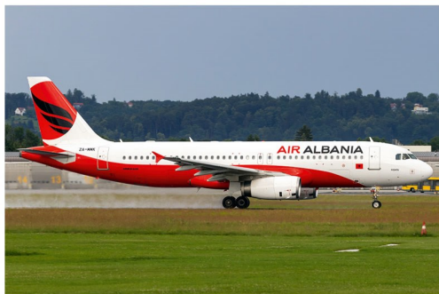
Die albanische Fußballnationalmannschaft war am 31. Mai an Bord des Air Albania A320. Das war zugleich die Erstlandung der Airline in Graz.