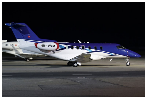
Die Pilatus PC-24 HB-VVM, zugelassen auf den Hersteller Pilatus Flugzeugwerke AG, kam ebenfalls am 19. März nach Graz.