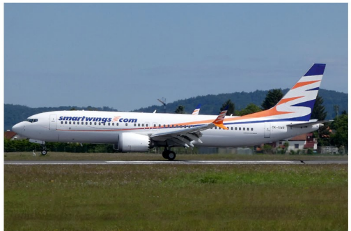
Die tschechische Fluggesellschaft Smartwings flog die diesjährige Kurzkette nach Ibiza von April bis Mai.