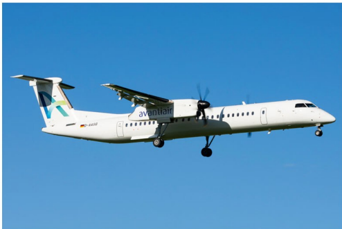
Auch in dieser Sommersaison verbindet die deutsche Avanti Air Graz mit zahlreichen Zielen in Griechenland sowie Calvy in Frankreich.