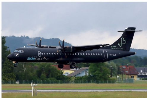
Aus dem dänischen Sønderborg kommend landete am 26. Mai die Air Alsie ATR 72-212A OY-CLZ. Weiter ging es dann nach Kopenhagen.