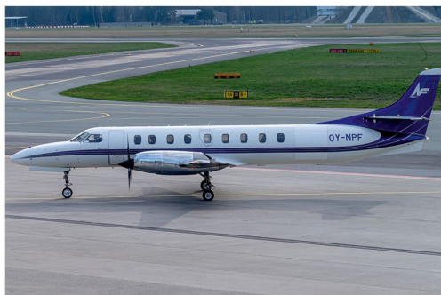
Am 19. März landete die Fairchild SA227-DC Metro 23 OY-NPF von North Flying bei uns am Graz Airport.