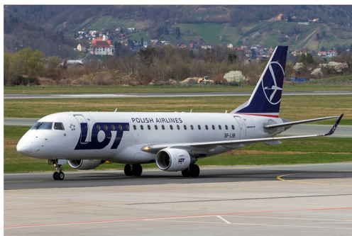
Die Mannschaft des FC Flora Tallinn charterte am 23. März die LOT Polish Airlines Embraer 175 SP-LIB für die Anreise nach Graz.