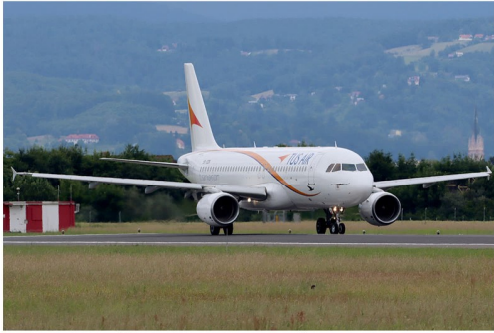
Am 1. Juni flog die zypriotische Tus Airways mit ihrem Airbus A320 5B-DDN im Subcharter für Corendon Airlines.