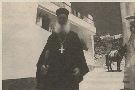
Springer-Helios hat ein umfassendes Griechenland-Programm.

P ersonalrochade bei den Tyrolean Airways in der Steiermark. Der bisherige Distriktsleiter