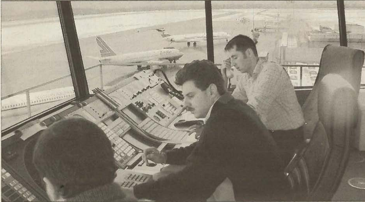
Hochbetrieb herrschte gestern auch am Thalerhof, weil Flugzeuge von Wien umgeleitet werden mussten ECKE HERGET

Graz. – Bloß einen gemütlichen Herrenabend wollte der Südsteirer Montagabend im Grazer Casino verbringen – als milliionenschwerer Glückspilz fuhr er wieder heim. Der 30-jährige Arbeiter knackte bei den Automaten mit nur dreimal drei Zehnern den „Mega Austria Jackpot“ und gewann damit genau 14,238.680 S. Mit dem Gewinn will sich der Südsteirer sein eigenes Haus bauen. Und spontan ließ er auch seinen Freund an dem Glück teilhaben – er schenkte ihm 100.000 S. Im vorigen Jahr wurde der „Mega Austria Jackpot“ nur einmal im Casino Graz geknackt. Nach der Gewinnausschüttung am Montag wurde der Automaten-topf mittlerweile bereits wieder mit fünf Millionen S aufgefüllt.