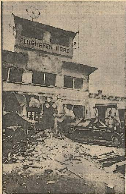
Das alte Flughafen-Abfertigungsgebäude in Graz-Thalerhof wird nun abgerissen

Am 1. August 1937 wurde mit dem Bau des Abfertigungsgebäudes begonnen. Der März 1938 brachte eine vorübergehende Ein-