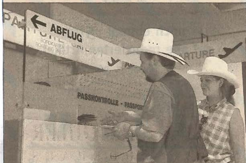
Der Mann und die Frau mit dem Hut: Urlaubsstimmung schon in Graz