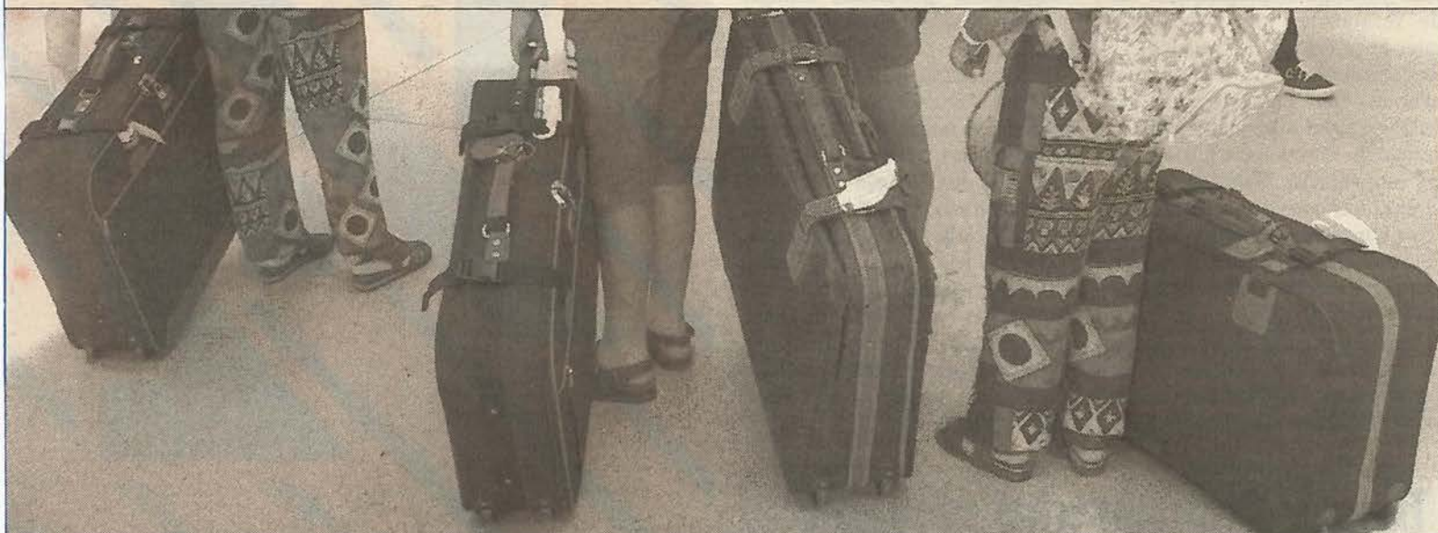
Kofferparade am Flughafen Graz-Thalerhof: Auf nach Griechenland, der Sonne entgegen. Wird schon alles eingepackt sein

Urlaubszeit ist Reisezeit: Am Flughafen in Graz herrscht reges Kommen und Gehen. Es wird