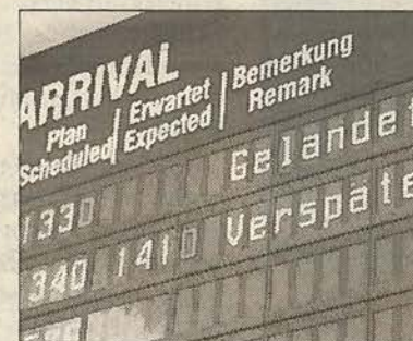
Gelandet, verspätet: Alles wartet