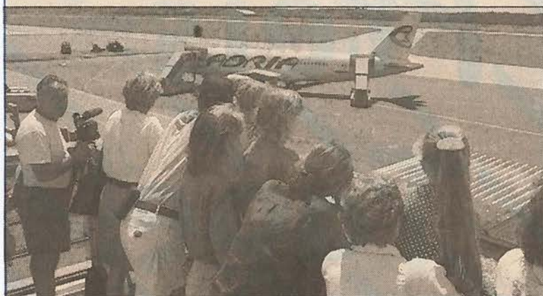
Ein letzter Blick, der Abflug wird noch schnell auf Video festgehalten