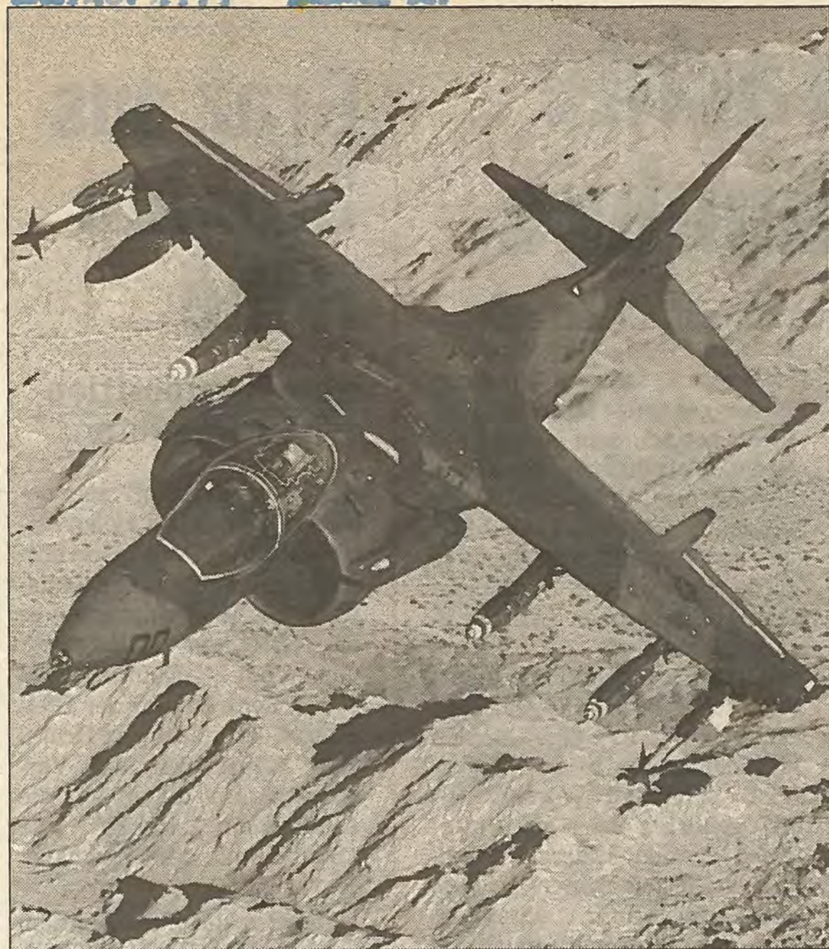
Senkrechtstarter Harrier aus England am Thalerhof dabei