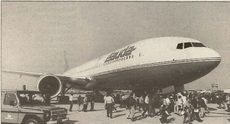
In den Sog der Siebensiebenseiben gerieten 10.000 Steirer