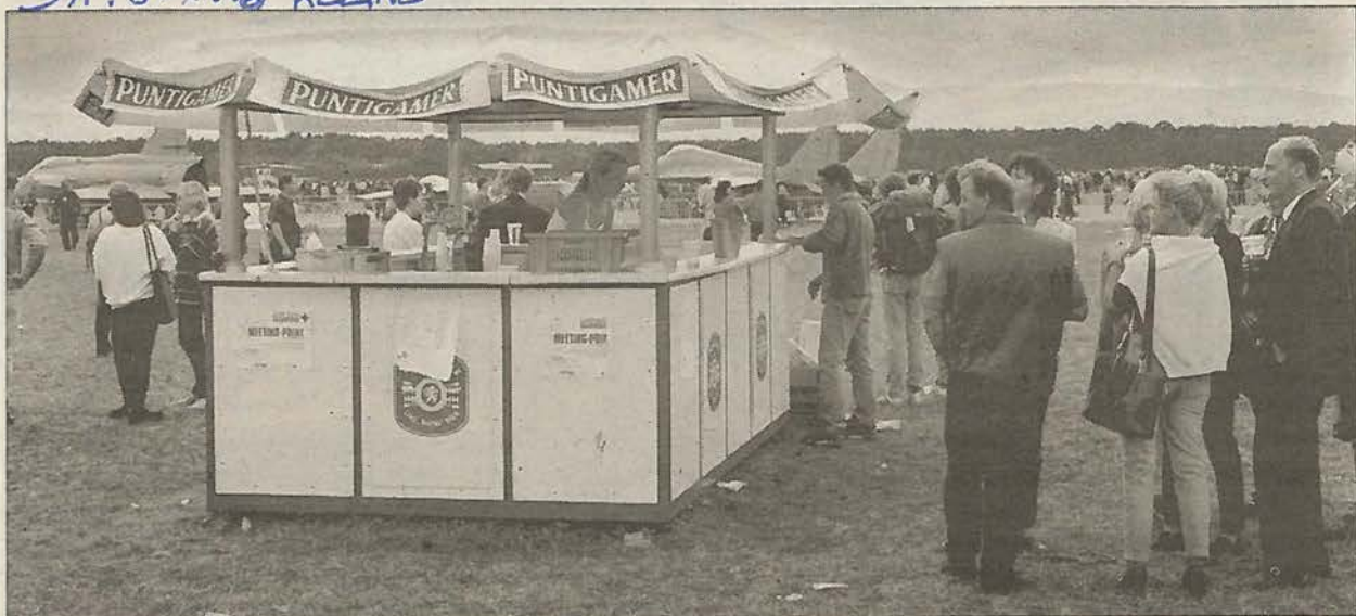
Grazer Airshow: Gastronomen klagen über „große Umsatzeinbußen“ wegen „katastrophaler Organisation“