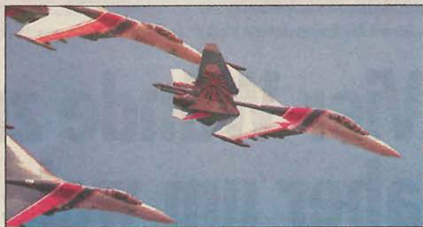
Vom Hubschrauber bis zur russischen „Sukoi-su27“: Die Airshow hatte für jedermann etwas zu bieten